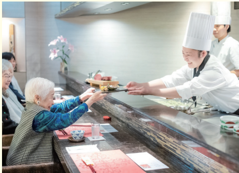
■ 和・洋・中 選べる6つのレストランとメニュー