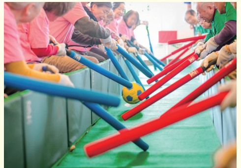
■ 365日愉しめるアクティビティやイベント