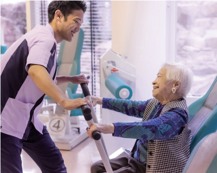
■ 若さと健康を保つエイジレストレーニング