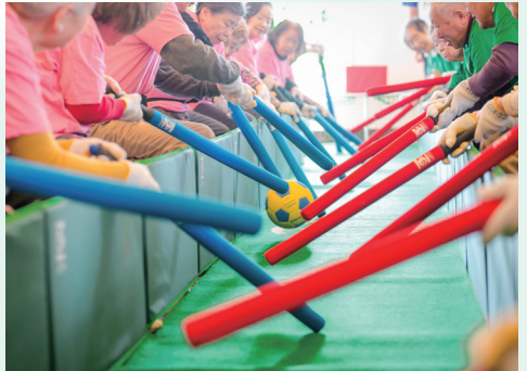
■ 365日愉しめるアクティビティやイベント