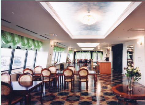
■ ご家族で愉しめる展望レストラン