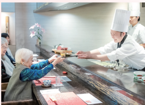
■ 選べる食の楽しみ