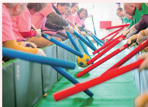
■ 365日愉しめるアクティビティやイベント