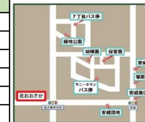
サニータウン・安威方面