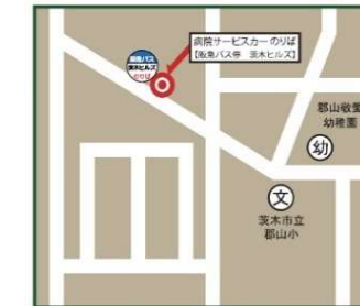
井口台・茨木ヒルズ